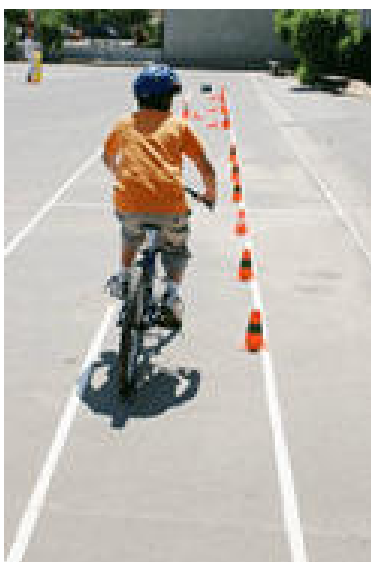
Séance d'éducation routière

Un don de 50 € permet de contribuer à l'achat d'un vélo pour nos pistes d'éducation routière