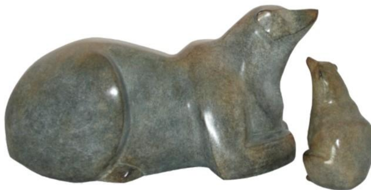
La Grande Ourse